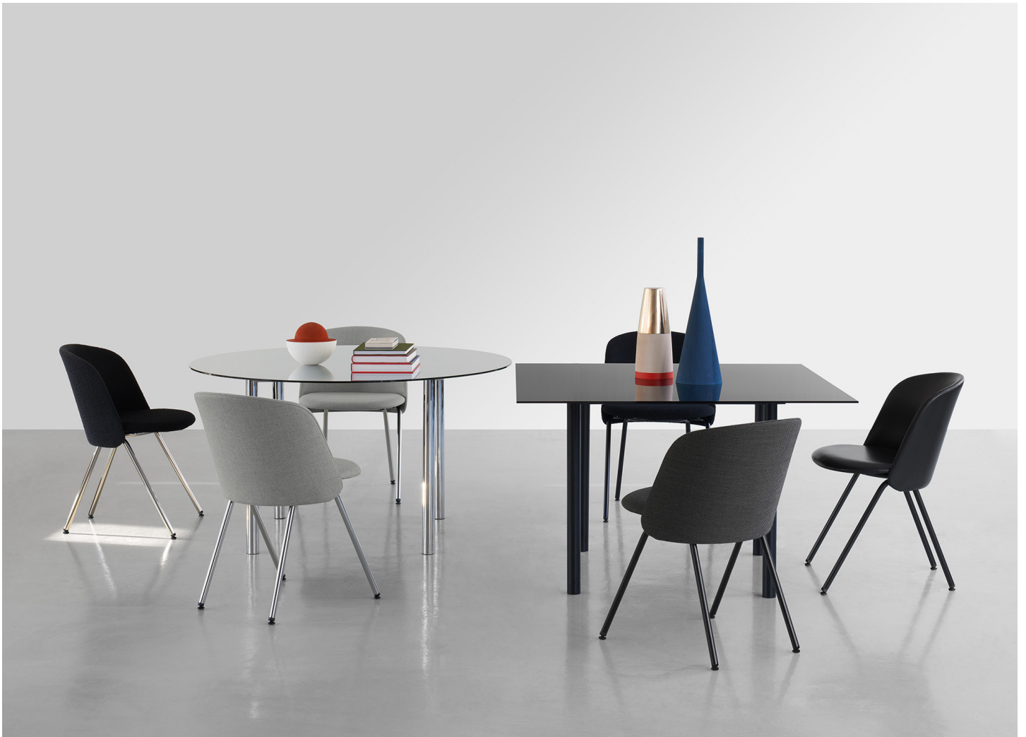
CH07 EITHER STUHL / CHAIR DESIGN: STEFAN DIEZ, 2023 VERCHROMT / CHROME-PLATED SCHWARZ PULVER BESCHICHTET / BLACK POWDER-COATED